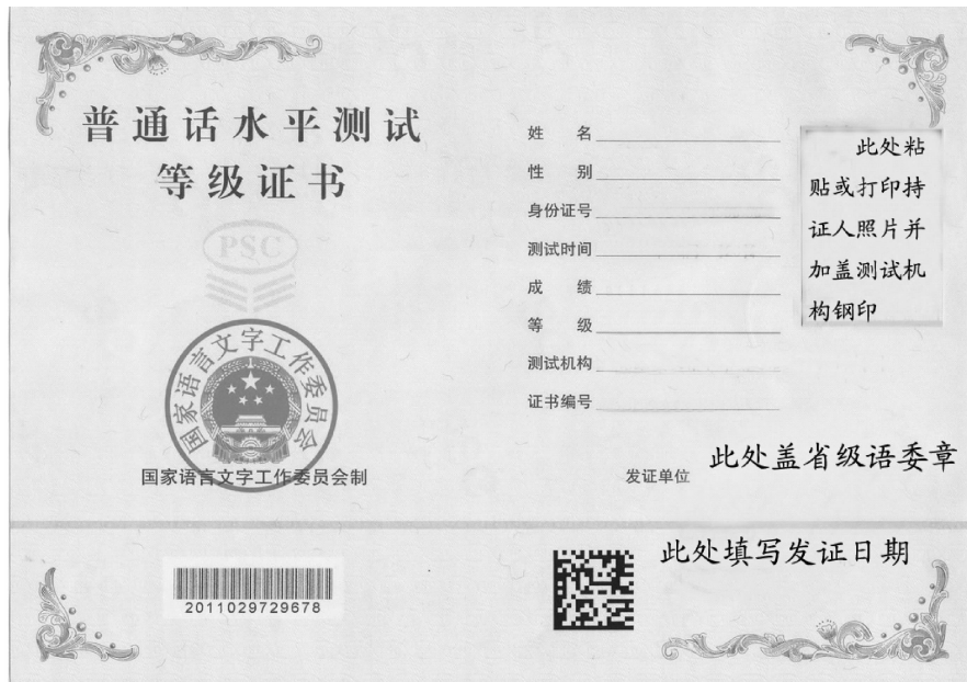
图 1-1 新版普通话水平测试等级证书

2010年1月，教育部语言文字应用管理司印发了《国家普通话水平测试等级证书管理办法(试行)》(教语用司〔2010〕2号)，文件规定，自2010年8月1日起，启用新版等级证书，2011年1月1日起一律核发新版等级证书，旧版等级证书不再核发。图1-1所示为新版普通话水平测试等级证书样式。