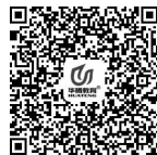
微课 职业的含义与特点

上述每一种说法都有其合理性,但也有局限性。不过由此可以看出,职业至少应包含四层含义:第一,并不是任何工作都可以成为职业,一项工作只有变得足够重要、足够丰富以至能吸引劳动者长期稳定地投入其中才能成为职业;第二,劳动者通过从事职业活动,不仅能