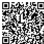
微课 商务谈判的 心理

科恩是美国一位著名的谈判大师,他的谈判生涯富有传奇色彩。有一次,他同妻子去墨西哥市。他们正在马路上观光时,妻子突然碰了一下科恩的胳膊说:“科恩,看到那边有什么东西在闪光。”科恩说:“唉,不,我们不去那儿。那是一个旅游者的商业区。如果你想去那个商业区的话,你去吧,我在旅馆里等你。”