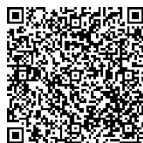
视频 不可思议的 谈判

互惠互利是商务谈判期望达到的最终结果。商务谈判不是竞技比赛,不能一方胜利一方失败,或者一方盈利一方亏本,因为谈判如果只有利于一方,不利方就会退出谈判,这自然导致谈判破裂,只有一方的谈判也就不称其为谈判了。因此,谈判各方只有在追求自身利益的同时,兼顾对方利益,立足于互补合作,才能互谅互让,争取互惠“双赢”,才能实现各自的利益目标,获得谈判的成功。