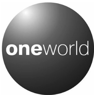
图 1-3 寰宇一家 Logo

大航空公司、澳洲航空公司、中国香港国泰航空公司等 5 家分属不同国家的大型国际航空公司发起结盟,其标志如图 1-3 所示。建立联盟前,这五家创始成员公司就已有密切联系,结盟进一步发展了联盟关系,结盟后的新措施包括:在与本公司不存在竞争关系的航线上,为其他成员公司的乘客提供票位安排服务;各成员公司的“经常性乘客”所获得的“里程优惠”可在成员公司之间互换通用;各成员公司的头等舱乘客可选择其他成员公司的机场候机室;等等。