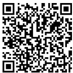
微课 自主创业的 要素

大学生应重新认识自我,根据自己身体、兴趣、气质、个性及能力等方面的因素,把自己放在最合适的位置上。大学生在择业时,都不同程度地存在着自大、冷漠、坐等、自卑、依赖、侥幸等消极心态,存在着以个人为本位的观念,这必然会影响他们的正常择业,导致择业出现偏差。大学生应以积极向上、乐观自信、勇于竞争的良好择业态度迎接就业,摆正自我与社会、奉献与索取的关系;在进行未来职业追求、规划、构思时,要做到不过高地估计自己,也不妄自菲薄,找准自己的社会角色,确定好自己的社会位置,这样才能有利于自身价值的实现。