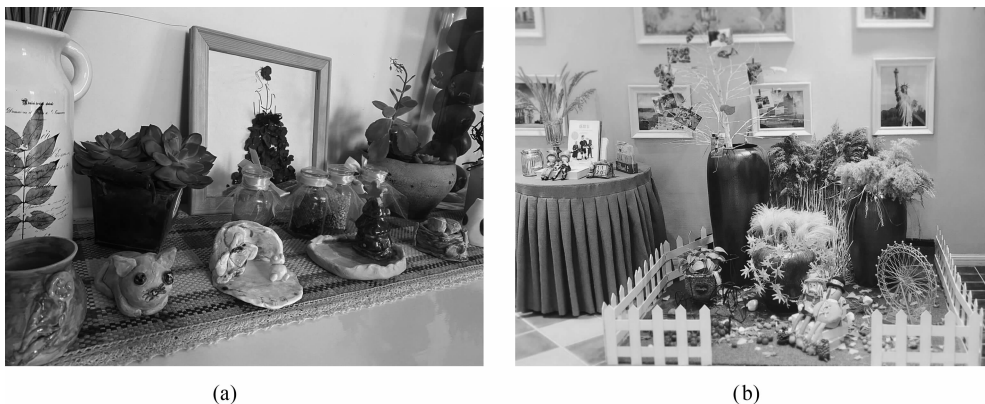
图 1-5 主题环境创设示例

(3) 主题环境创设应生动、直观、真实,环境布置不要局限于墙上,也不要局限于只用贴的方法。例如,教师在教室的某个角落里,某个窗台或某个柜子上适时放置物质材料,以调整环境的设置,如图 1-5 所示。环境创设不仅要有主题,而且要能动,或者悬挂,或者有序列地摆放,或者放在孩子自己的小柜子里,这样可使教育活动有所延伸,使主题墙的内容也得以延伸。