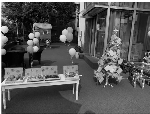
图 1-1 幼儿园环境①

环境是指人生活于其中,并能影响人的一切外部条件的综合。这个外部条件的综合既包括人在社会生活中的条件和社会关系的综合,也包括人们生存的自然条件的综合。相对一般环境而言,幼儿园环境(图 1-1)是一种特殊的环境,即教育环境,它有广义和狭义之分。广义的幼儿园环境是指幼儿园教育赖以进行的一切条件的总和,它既包括幼儿园内部小环境,也包括与幼儿园教育有关的家庭、社会,以及自然、文化等大环境。狭义的幼儿园环境是指幼儿园中对幼儿身心发展产生影响的一切物质与精神要素的总和,它是涵盖幼儿园房舍、设备设施、空间布局及各种信息要素,并通过一定的教育制度、观念及文化传统所组织、综合的一种动态的、有形与无形相结合的教育空间范围。