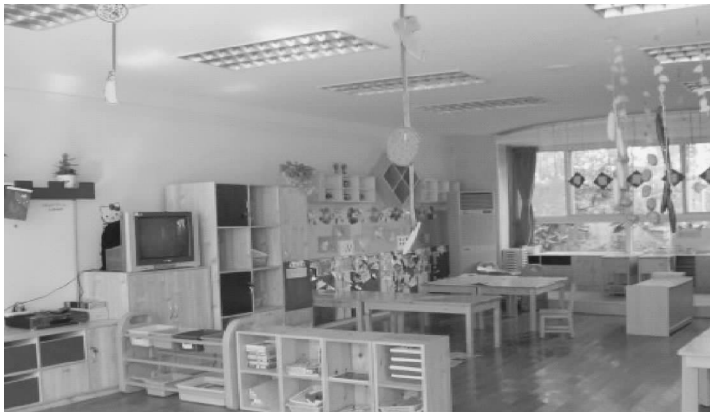
图 2-4 活动室的规划

幼儿园色彩要鲜亮明快,艺术性强且富有童趣。3~6岁的孩子一般喜欢亮丽和谐的颜色,这既是他们的心理特点,也是他们的心理需要。从色彩学上说,高透明度、高饱和度的颜色,暖色的搭配和创意,可以使孩子具有欢快、兴奋及喜悦的心情。所以在装修设计中,一般采用淡黄、湖蓝及紫色。这几种颜色颇具感情和自然气息,互相搭配加创意可以形成活泼、欢快的氛围。环境的铺陈须符合幼儿的年龄、需要及习惯,室内桌椅以原木色为主,布置不宜太复杂,以简明有序为佳,较安静的区域应与活动量大的易发生嘈杂音的活动区相分离,以免相互干扰,如图2-4所示。