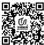
微课 区域活动材料