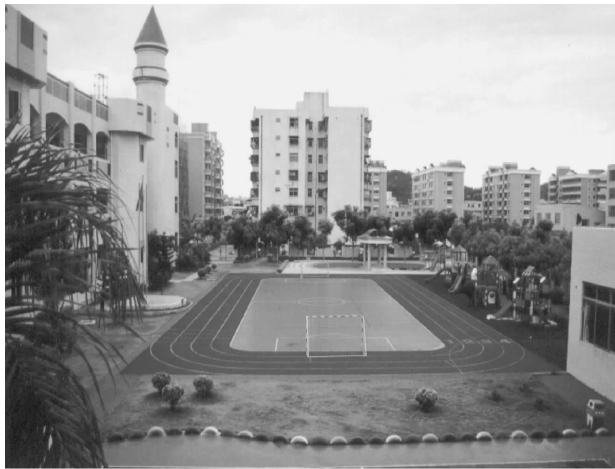
图 2-3 幼儿园活动空间