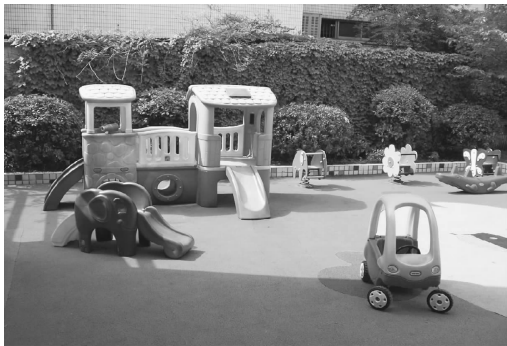
图 2-9 大型运动器械

(2) 中、小型运动器械材料,主要有高跷、跳绳、沙包、球、皮筋、小推车、飞盘、轮胎、滑板、平衡台等。