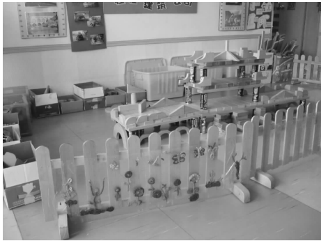
图 2-6 建构区材料的投放

c. 简单易懂的搭建图示,如平铺、叠高、延伸的具体方法图示,幼儿搭建成功的照片,各类型桥梁、建筑物的图片等。