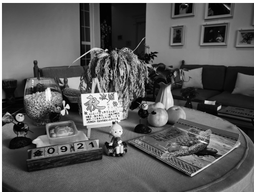
图 1-4 秋季主题环境创设示例

(1) 主题环境的创设内容不是一成不变的,可以随时变化。主题环境的创设内容可随着幼儿的兴趣和需要而改变,随着季节或者主题的变化而变化。教师要根据孩子的需要不断丰富和改变环境创设。在这个过程中,幼儿不断收集、储存、整理、交流与分享信息,他们的观察、思维、交往与表达的能力均获得了提高。秋季主题环境创设示例如图 1-4 所示。