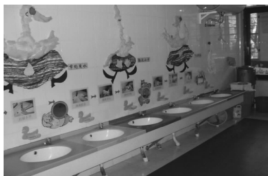
图 2-5 盥洗间的布置

为了保障幼儿日常生活需要,应配备饮水设备、消毒设备,如保温桶、水杯柜、消毒柜等;寝室配备供午休的固定床,也可根据实际情况配置叠放收藏的硬板床或床垫,床的长度应符合幼儿身高要求,床的四周设高度不低于30厘米的护栏,床间通道宽度不得小于60厘米;盥洗间应配备与幼儿的身高、数量相适应的梳洗镜、洗手盆和防溅水龙头,如图2-5所示。厕所采用水冲式,配置适量的幼儿坐便器或沟槽式便池,沟槽式便池应设置幼儿扶手,提倡男女分厕,地面采用防滑材料。