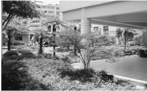
图 2-2 绿化游乐区的规划

(1) 绿化游乐区面积在规划时应尽可能大。幼儿园的绿化率应不低于 30%，另外，在辅助设施上多做一些景观布置，让孩子多接触大自然和绿色植物。绿化游乐区的规划如图 2-2 所示。