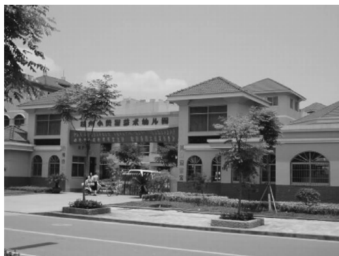
图 2-1 幼儿园园舍布局

幼儿园园舍规划应遵循幼儿的发展规律及各年龄阶段幼儿的特点,依据幼儿教育、心理、生理方面的科学理论,在建筑规划、设施制定、环境规划及实施建置工作中,必须坚持科学的态度,合理布点,独立设置。幼儿园园舍布局如图2-1所示。