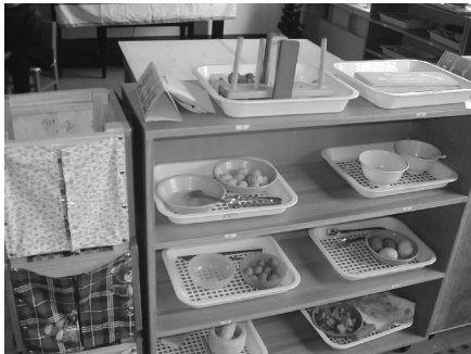
图 2-8 练习手指、手掌、手腕配合运动的材料