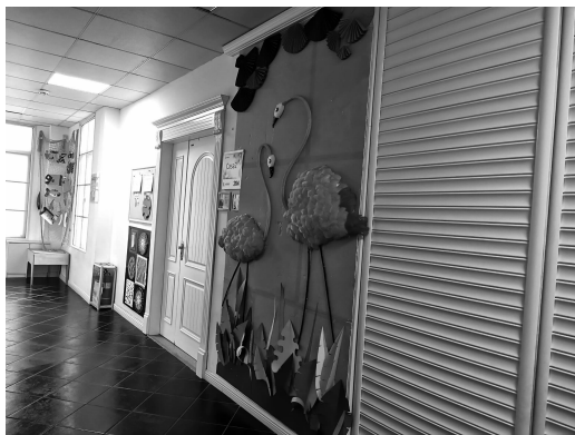
图 1-2 幼儿园墙面布置

(2) 可操作性与创造性的结合。幼儿园在区角物质环境创设上要注重幼儿的动手操作能力及创造性的发展。区角物质环境的创设要能吸引孩子,激发他们自己观察的兴趣,满足他们的好奇心和求知欲。操作性和创造性的结合能达到锻炼孩子的效果。