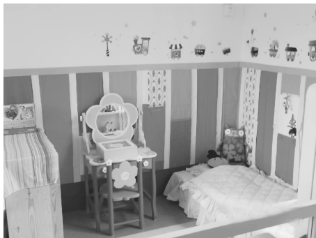
图 2-7 成品材料的投放

b. 收集材料,具体包括与情景相适应的各种用具,如商店的货物、小货架、收银机等,医院的制服、输液器、体温计、药瓶、药盒、听诊器、病床等。