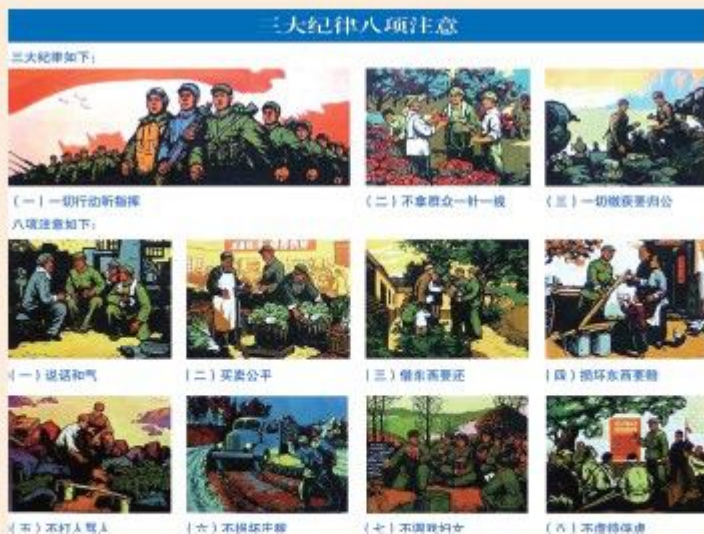
《三大纪律八项注意》（绘画）

（一）一切行动听指挥；（二）不拿群众一针一线；（三）一切缴获要归公。八项注意是：（一）说话和气；（二）买卖公平；（三）借东西要还；（四）损坏东西要赔；（五）不打人骂人；（六）不损坏庄稼；（七）不调戏妇女；（八）不虐待俘虏。从此，三大纪律八项注意就以命令的形式被固定下来，成为全军的统一纪律。