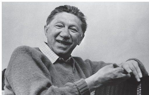
图 1-5 亚伯拉罕·马斯洛