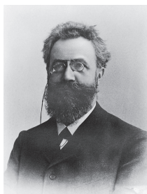
图 1-1 赫尔曼·艾宾浩斯

德国著名心理学家赫尔曼·艾宾浩斯（Hermann Ebbinghaus，1850—1909，见图 1-1）曾概括地描述心理学的发展历程：“心理学有一个漫长的过去，但只有短暂的历史。”意思是说，心理学是一门既古老又年轻的科学。