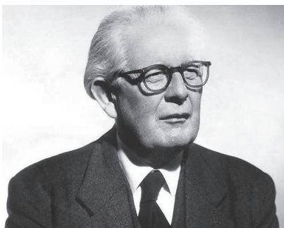
图 1-7 皮亚杰

认知心理学派是 20 世纪 50 年代在西方兴起的一个心理学新流派，并已成为当前心理学研究的主要方向。从广义上讲，心理学中凡侧重研究人的认知过程的学派都可称为认知心理学派，如皮亚杰（Jean Piaget，1896—1980，见图 1-7）学派也被认为属于认知心理学派。