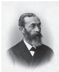
图 1-2 威廉·冯特

1879年，德国哲学家、心理学家威廉·冯特（Wilhelm Wundt，1832—1920，见图1-2）在莱比锡大学建立了世界上第一个心理学实验室，用自然科学中的方法研究心理学现象，使心理学从哲学中脱离出来，成为一门独立的科学，标志着心理学的诞生，冯特也被视为科学心理学的创始人。与其他科学（如数学、物理学、生物学等）相比，心理学是一门非常年轻的、处于发展中的科学。