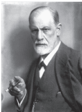
图 1-4 西格蒙德·弗洛伊德

精神分析说是奥地利精神病学家西格蒙德·弗洛伊德（Sigmund Freud，1856—1939，见图 1-4）19 世纪末在精神疾病的治疗实践中创立的一种独特的心理学理论。弗洛伊德的代表作有《梦的解析》《精神分析引论》《精神分析纲要》等。