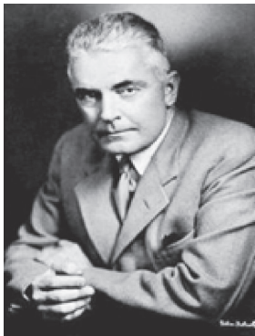
图 1-3 约翰·华生

行为主义学派是由美国心理学家约翰·华生（J. B. Watson，见图 1-3）于 20 世纪初创立的一个西方心理学的主要流派。华生主张只有从可观察到的刺激和反应方面去研究，心理学才能成为像生物学、物理学、化学那样的自然科学。刺激 - 反应（S-R）是华生行为主义的公式。华生坚决主张把人的心理彻底生物学化和动物学化，他认为：“对人的行为和动物的行为必须在同一层面来考虑。”他特别重视行为的分子概念，即将行为看作许多生理细节的组合。华生坚定地认为，心理学研究的目的是寻找预测和控制行为的途径，传统心理学中的意识、感觉、知觉、意志、表象等是一大堆无用的概念，应被彻底摒弃，而代之以刺激、反应、习惯形成、习惯联合等概念。这种完全摒弃意识，贬低大脑的作用，只研究行为的行为主义被称为激进的行为主义。