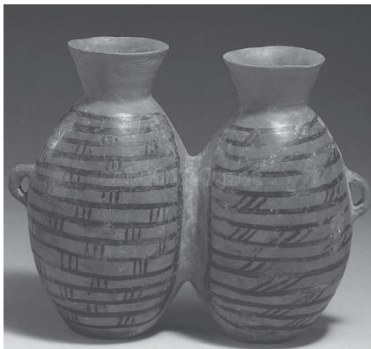
图 1-3 仰韶文化的代表——彩陶双连壶