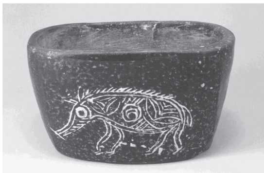
图 1-2 河姆渡文化的代表——黑陶

距今约 10 万年前，氏族公社开始形成，分为母系氏族公社和父系氏族公社。考古发现比较有代表性的母系氏族公社为山顶洞人遗址、河姆渡文化遗址、半坡遗址、仰韶文化遗址等。著名的父系氏族公社有大汶口文化、龙山文化、良渚文化等。距今 30 000 多年的山顶洞人已经能磨制骨针和骨、石饰物。在距今 6 800 多年的河姆渡文化时期，中华先民已进入新石器时代，生产、生活用具已是精致的石器、骨器及手制的陶器（见图 1-2），农业已有相当程度的发展。在公元前 5000 年到公元前 3000 年的仰韶文化时期，居民已经过上了定居的农业生活，家畜饲养已经开始，陶器已有了颜色花纹（见图 1-3）。距今 4 000 ~ 5 000 年的良渚文化时期，稻作农业、竹木制作、养蚕、丝织、麻织等都有了重要的发展，并有了较精美的玉器（见图 1-4）。象形刻画符号、彩绘、岩画、雕刻反映了 4 000 多年前中华先民的经济、文化、艺术的发展。原始宗教在此阶段也已产生，中华先民崇拜自然，崇拜祖先，崇拜图腾，各种祭祀活动盛行。