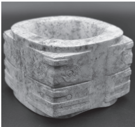
图 1-4 良渚文化的代表——玉器