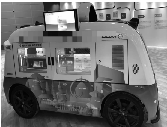
图 1-1 智能网联汽车

车联网系统,是指通过在车辆仪表台安装车载终端设备,实现对车辆所有工作情况和静态信息的采集、存储并发送。智能网联车可以理解为“互联网+”模式和汽车产品有机结合的产物。智能网联汽车,即 ICV(Intelligent Connected Vehicle),如图 1-1 所示,是指车联网与智能车的有机联合,是搭载先进的车载传感器、控制器、执行器等装置,并融合现代通信与网络技术,实现车与人、车、路、后台等智能信息交换共享,实现安全、舒适、节能、高效行驶,并最终可替代人来操作的新一代汽车。