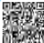
图文 国家职业分类大典 (二〇二二年版) 公示

1995年原劳动部、原国家质量技术监督局、国家统计局牵头启动《职业分类大典》的编制工作,于1999年颁布了我国第一部《职业分类大典》,填补了我国职业分类工作的空白,标志着适应我国国情的国家职业分类体系基本建立。随着经济社会发展、科学技术进步和产业结构调整,社会职业构成和内涵发生较大的变化。2010年年底,我国启动《职业分类大典》的第一次修订工作,历时5年,颁布了2015年版《职业分类大典》。